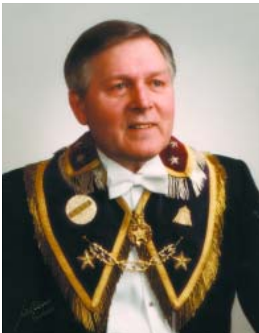
Oktober 1979 - oktober 1988.

Venskabsfonden, som er oprettet i vor Moderloge, blev nu fælles for begge broderloger.