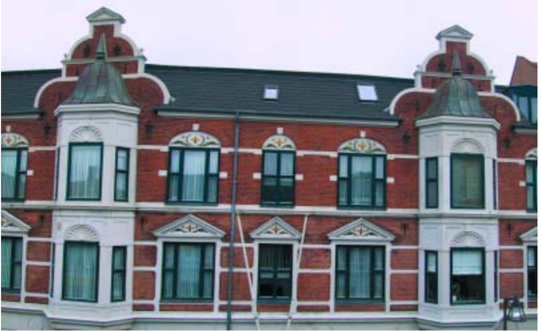
Loge nr. 107 Suså er siden 1981 medejer af Logebygningen, Jernbanegade 3 i Næstved.