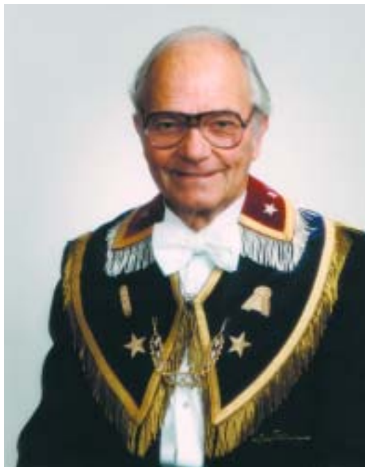
Oktober 1979 - september 1984.