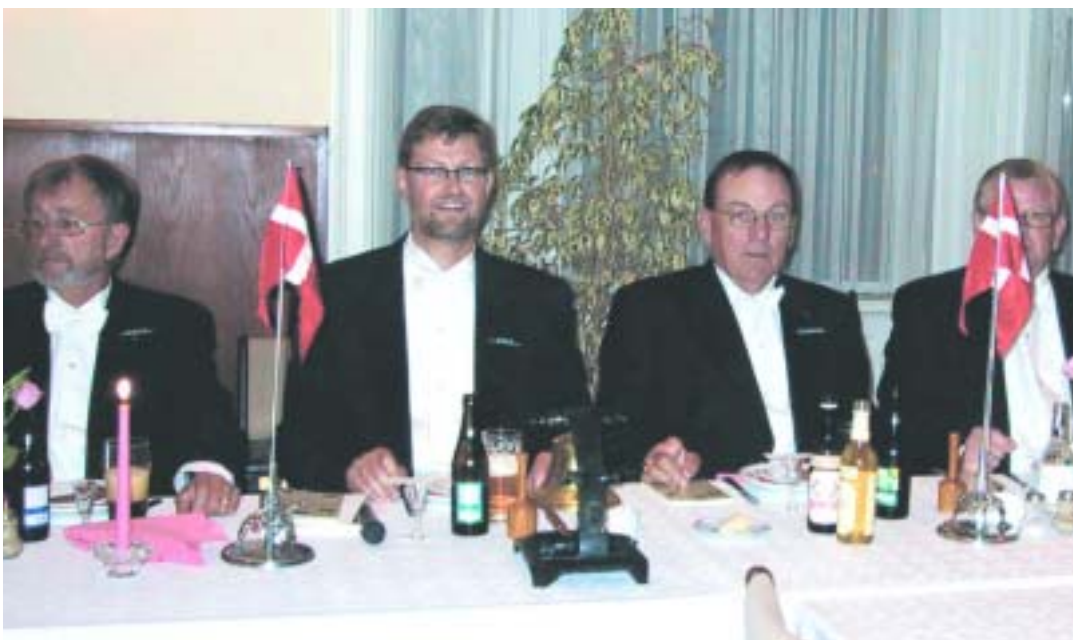
En aften i jubilæumsåret 2004. Logearbejdet er sluttet og det er tid til at nyde bordets glæder.

Broderloge nr. 107, Suså med jubilæumsdagen.