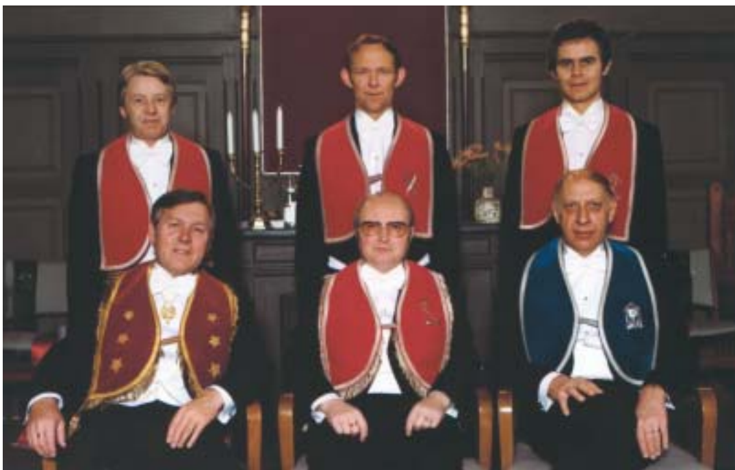
Loge nr. 107 Suså, Næstved, de første valgte embedsmænd. 1979-1981.

“Nu er denne nye Loge institueret som nr. 107 i rækken af Odd Fellowloger i Danmark. Brødrene her har udført et stort arbejde for at danne denne Loge. Det at være med i en