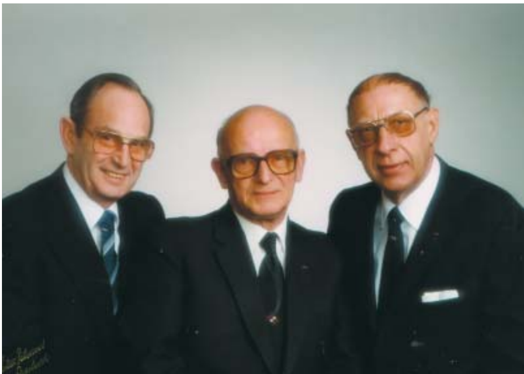
Odd Fellowforeningen "Suså". 9/3 1978 - 27/10 1979.